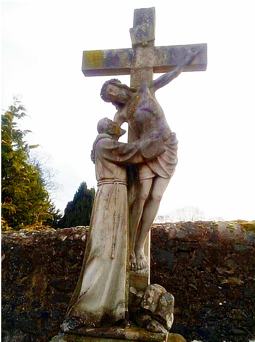
Diese Kreuzesverehrung befindet sich auf dem Friedhof des Klosters Frauenberg in Fulda.